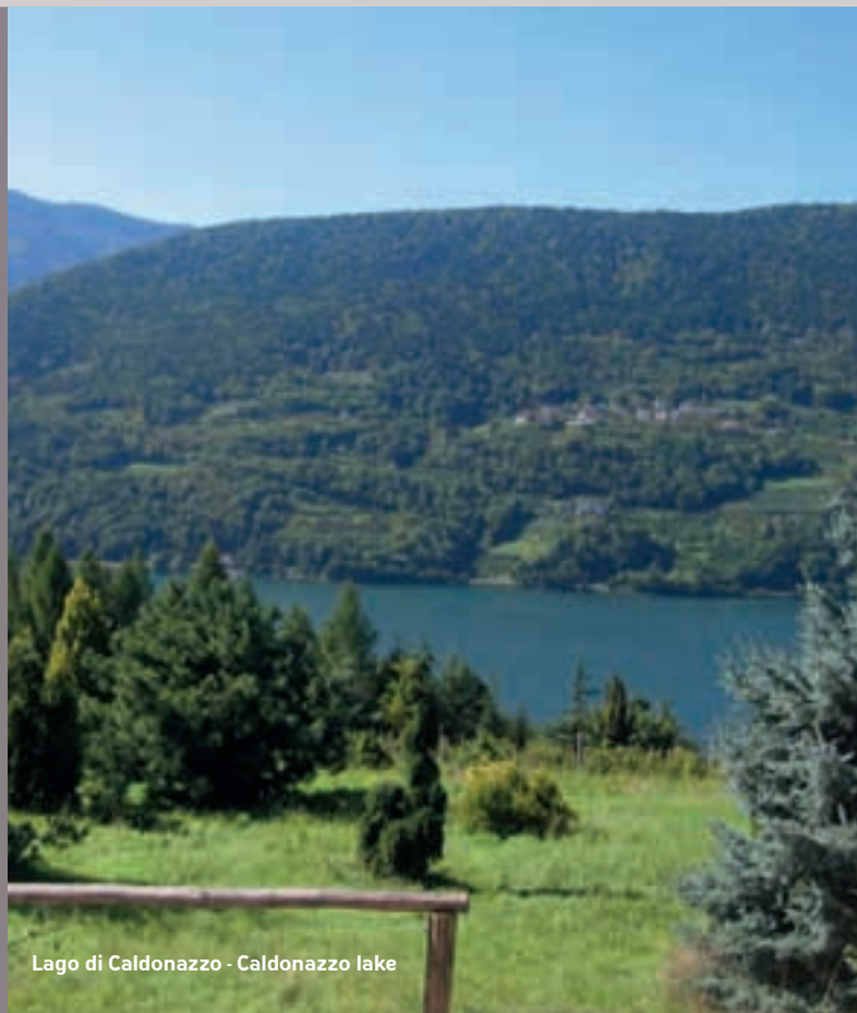
Lago di Caldonazzo - Caldonazzo lake

APERTURA / OPENING: 01/05 - 30/09 ■ SPESE INCLUDE / ALL INCLUSIVE PRICES